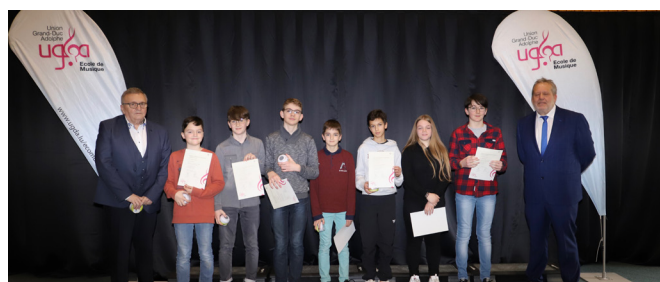
Remise nationale des diplômes du 1 er mars 2020 - élèves de la Commune de Steinsel