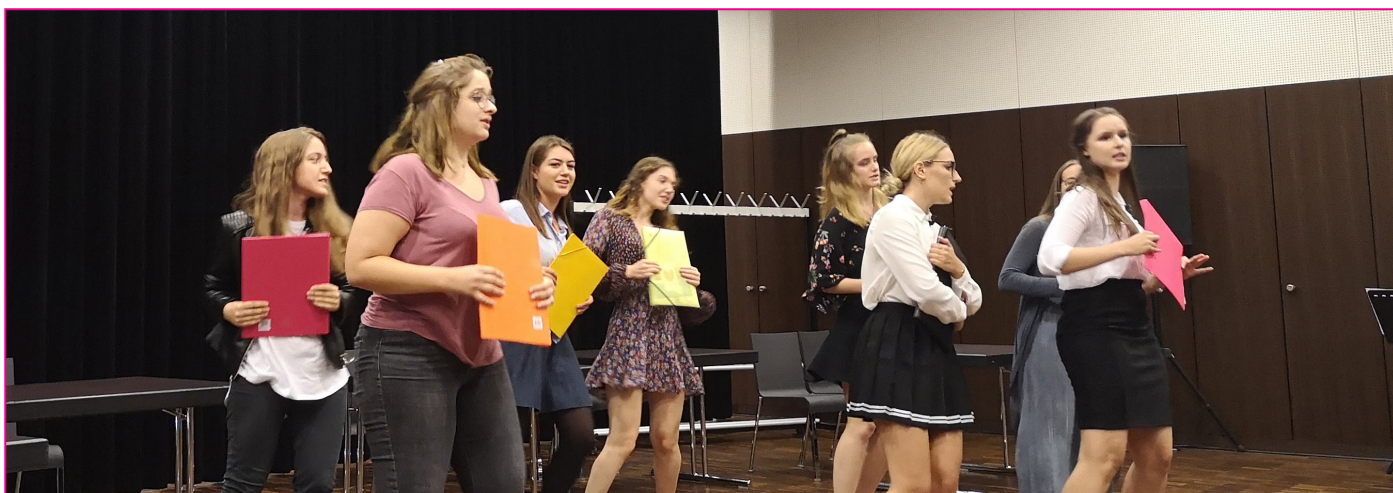
Performance publique des élèves des classes de la «Regional Museksschoul Westen», «Regional Museksschoul Uelzechtdall» et «Regional Museksschoul Syrdall» à Mamer

Ecole de musique de l'UGDA • tél.: 22 05 58-1 www.ugda.lu/ecole-de-musique