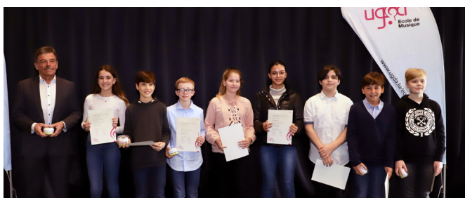
Remise nationale des diplômes du 1 er mars 2020 - élèves de la Commune de Mersch