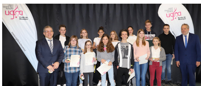
Remise nationale des diplômes du 1 er mars 2020 - élèves de la Commune de Walferdange