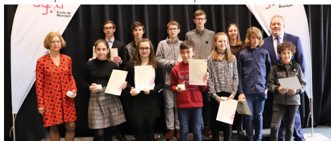
Remise nationale des diplômes du 1 er mars 2020 - élèves de la Commune de Lorentzweiler