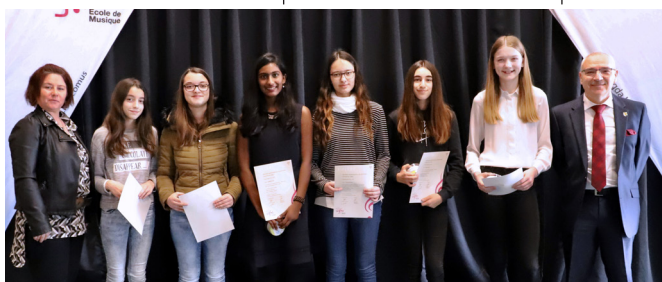
Remise nationale des diplômes du 1 er mars 2020 - élèves de la Commune de Lintgen