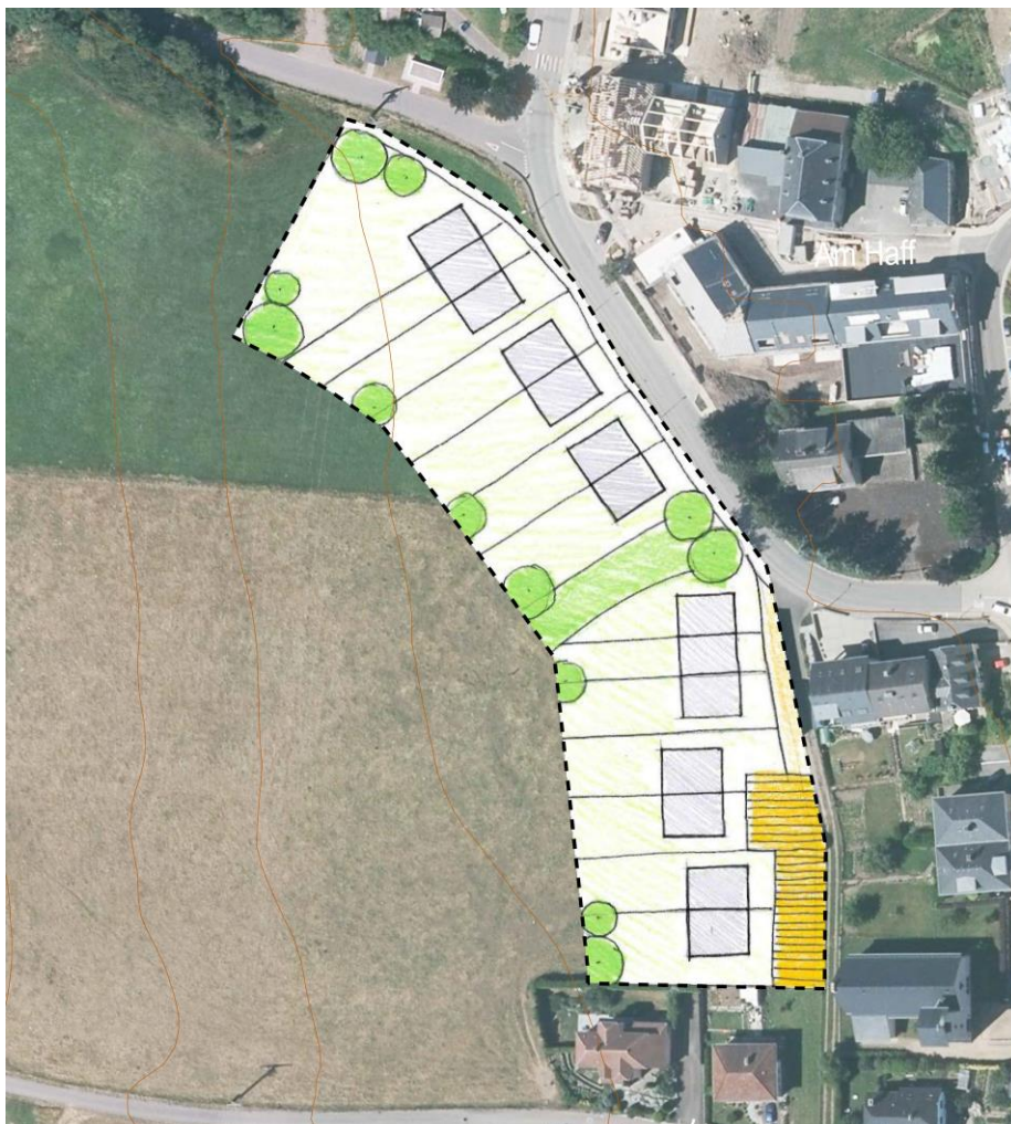
Abbildung 3 Konzeptskizze