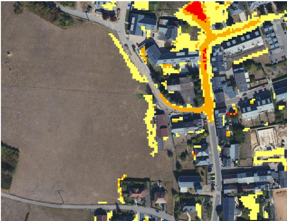
Abbildung 4 Starkregengefahr