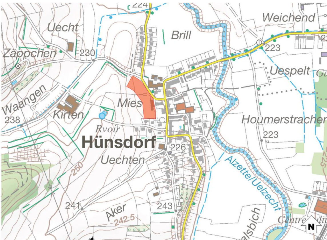
Abbildung 1 Verortung des Plangebietes (Topografische Karte)