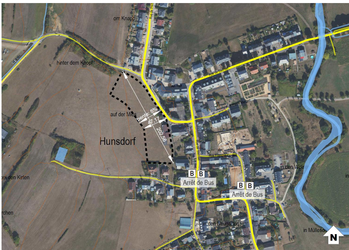
Abbildung 2 Verortung des Plangebietes (Luftbild)