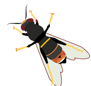
Asiatische Runn Frelon asiatique