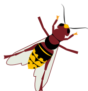
Europäesch Runn Frelon européen