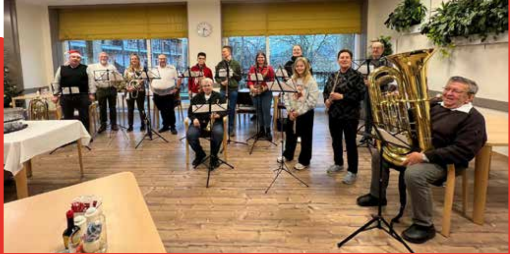
Amibo Adventfeier 2025