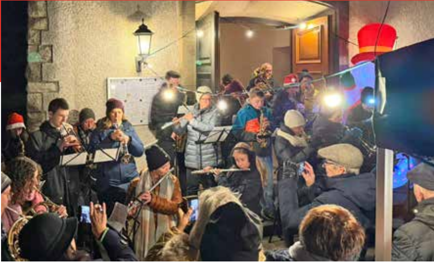
Glühwain-Owend Hënsdref 2025